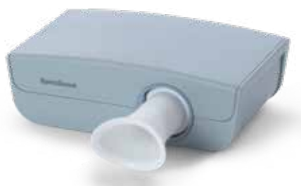
Espirometro por ultrasonidos SpiroScout SP plus